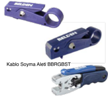
Kablo Soyma Aleti BBRGST